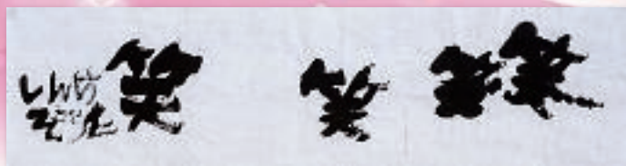
笑笑 新家 壮太(福井県)