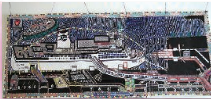
太平洋フェリーいしかり 杉上 彰治(宮城県)