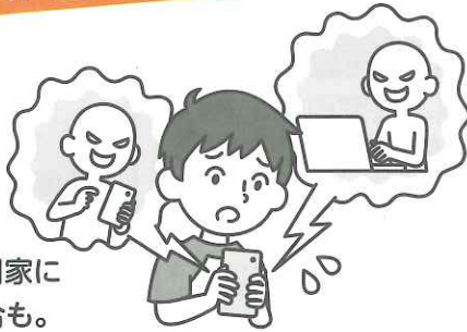
パソコンや携帯電話等を使ったいじめの認知件数